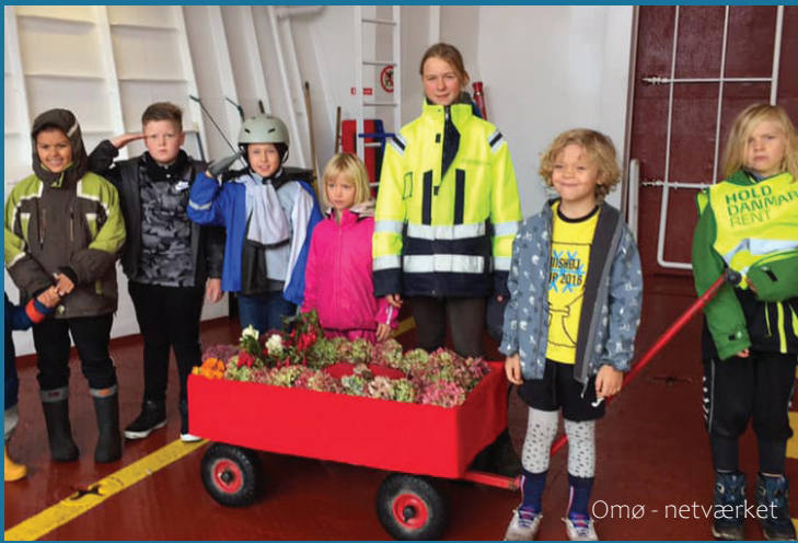
Omø - netværket